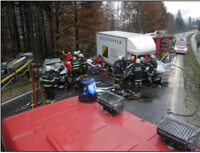
VU B 145 Steinkogel 10.11.