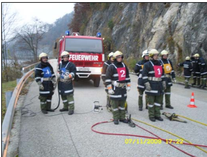
Ablegung THL 07.11.