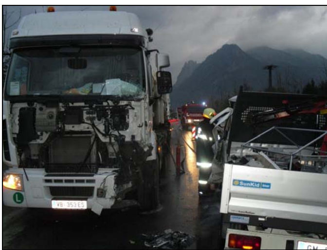
VU Brückenbaustelle 02.10.