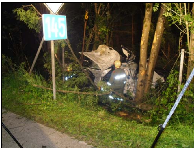
VU B 145 Steinkogel 2 Tote 21.07.