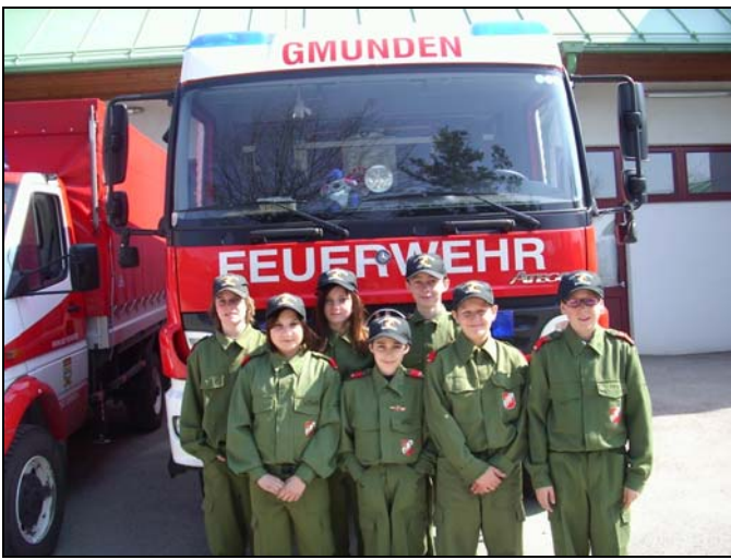
Wissenstest - Jugend 04.04.