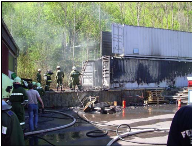
Containerbrand Leirich 25.04.