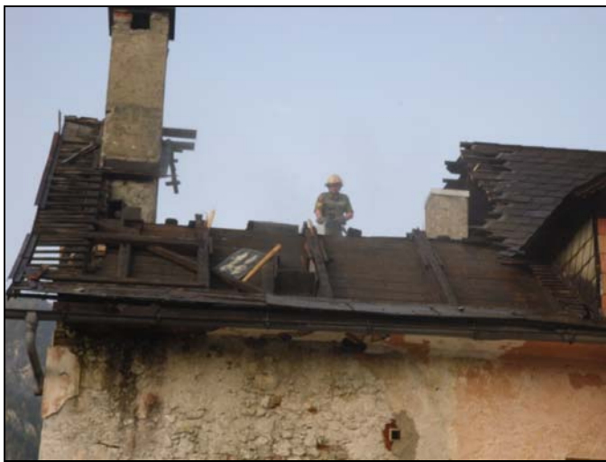
Brand Bahnhofstraße 19.09.