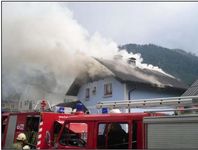
Brand Pfaffingstraße 05.07.