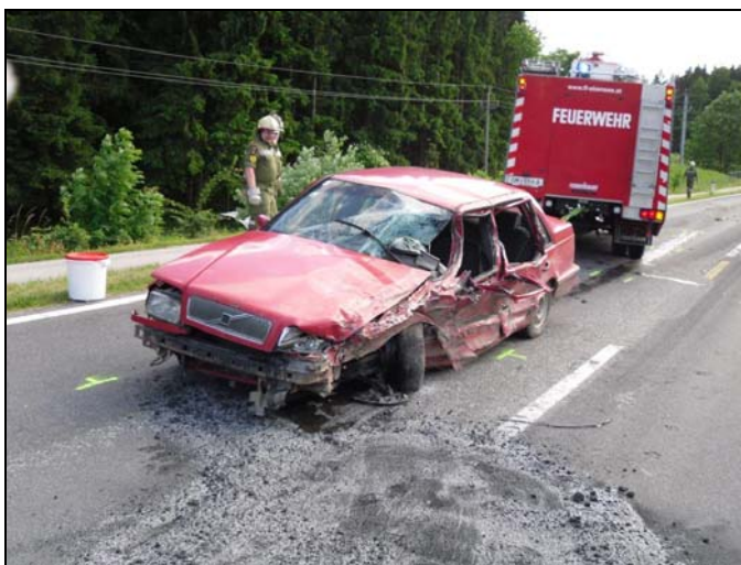
VU B 145 Polanschütz 08.06.