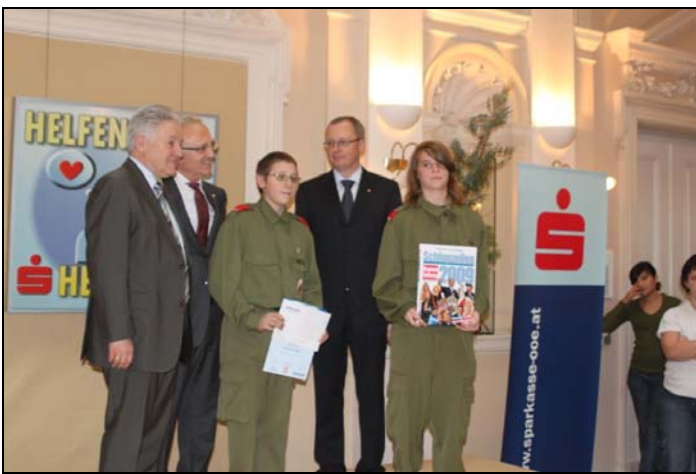
Ehrung Junge Helden Linz 26.11.

Mehr unter www.ff-ebensee.at in der Fotogalerie!