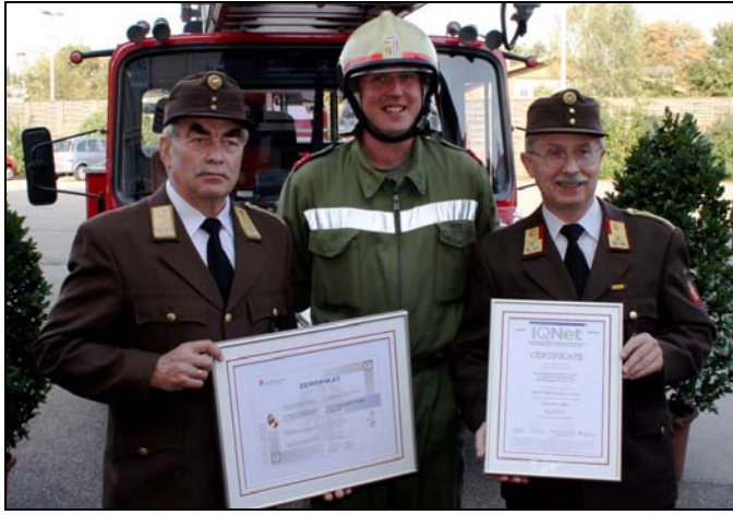
260.000 LG-Teilnehmer LFS 05.10.